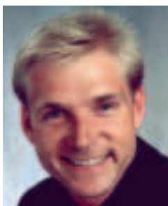
Kristian Thulesen Dahl