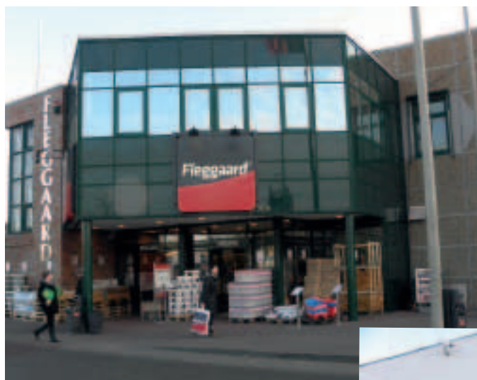
Fleggaard er på størrelse med et stort Føtex-supermarked. Her tales og handles dansk.

I indeværende år bliver beløbet sandsynligvis større.