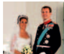
Prins Joachim og prinsesse Marie blev 24. januar forældre for anden gang.

Ingrid odds 5,00 - Mathilde odds 8,00 - Anna odds 10,00 - Liv odds 10,00 og Emma odds 10,00