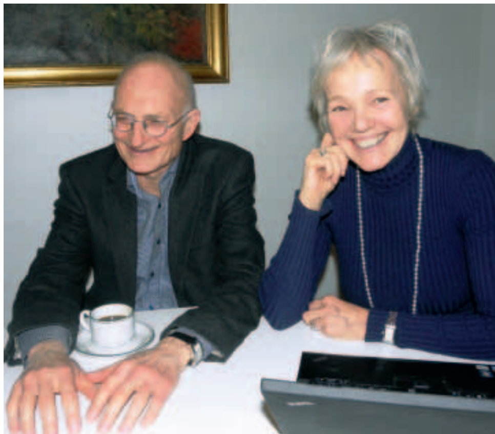
Karen Jespersen og Ralf Pittelkow har udgivet ny netavis.