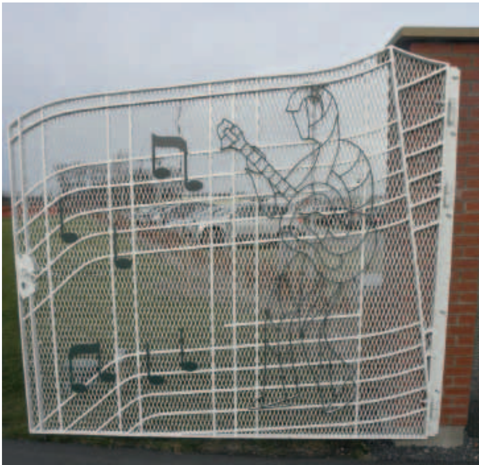
Den imponerende tofløjede smedejernslåge er en nøjagtig kopi af den, der giver adgang til Graceland Memphis.