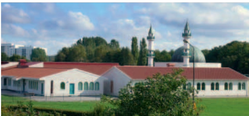
Antallet af indvandrere er eksploderet og udgør nu 38 pct. af Malmøs borgere. Byen har også fået Nordeuropas største moské.

Urolighederne eskalerede med ildspåstøtser og hærværk mod biler. Veje i området blev blokeret og et par hundrede unge tog opstilling på en vejbro, hvorfra de kastede sten og andet kasteskyts mod passerende køretøjer.