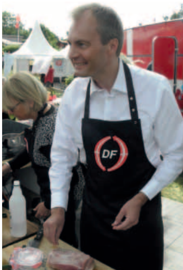
Peter Skaarup har fået en plads opkaldt efter sig. Her ses DF-profilen ved Folkemødet på Bornholm sidste år...

Peter Skaarup drøftede, hvilke initiativer der kan tages for at hjælpe Bornholm som øsamfund. Konsekvenserne af tilbagerulningen af den tidligere indgåede aftale om grænsekontrol blev også taget op.