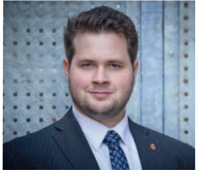
Anders Vistisen advarer EU-tilhængerne: Hvis ikke regeringen banker i bordet, skal vi have en ny afstemning om retsforbeholdet.

”Dansk Folkeparti har allerede foreslået disse tiltag, fordi vi kun på den måde kan forhindre, at Danmark bliver en flygtningemagnet, og vi er helt på det rene med, at det indebærer et farvel til Schengen-samarbejdets åbne grænser. Men det kan vi tage helt roligt, for flere og flere lande er nået til den samme erkendelse, og her tænker jeg først og fremmest på landene langs Balkan-ruten. De har prioriteret deres egne borgeres sik-