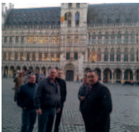
Et besøg på den smukke Grand Place i hjertet af Bruxelles.