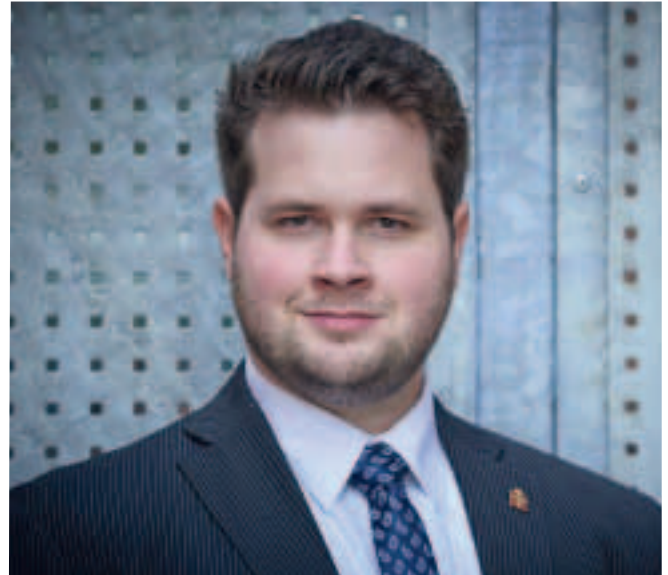
Anders Vistisen advarer EU-tilhængerne: Hvis ikke regeringen banker i bordet, skal vi have en ny afstemning om retsforbeholdet.

”Dansk Folkeparti har allerede foreslået disse tiltag, fordi vi kun på den måde kan forhindre, at Danmark bliver en flygtningemagnet, og vi er helt på det rene med, at det indebærer et farvel til Schengen-samarbejdets åbne grænser. Men det kan vi tage helt roligt, for flere og flere lande er nået til den samme erkendelse, og her tænker jeg først og fremmest på landene langs Balkan-ruten. De har prioriteret deres egne borgeres sik-