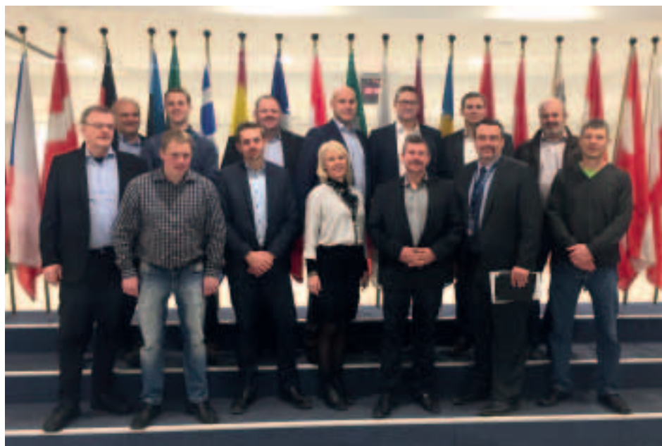
LandboSyd på besøg i Europa-Parlamentet