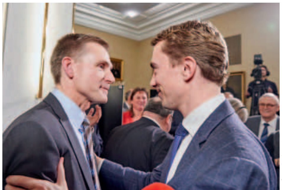
En glad og lettet Morten Messerschmidt fejrede det gode resultat af afstemningen om retsforbeholdet sammen med andre glade DF’ere i Snapstinget på Christiansborg – her i selskab med Kristian Thulesen Dahl.

”Denne valgaften bør i virkeligheden være begyndelsen på noget helt nyt. Demokratiet virker. Vælgerne har talt. Nu er det op til politikerne at lytte. Jeg håber, at splittelsen mellem befolkning og flertallet på Christiansborg er noget, der havner på historiens losseplads. Nu må ja-siden til at vågne op og erkende, at de har været ude af trit med deres vælgere. Det er ikke danskerne, der har taget fejl, men de politikere, som bilder sig ind, at Danmark skal ind til kernen af EU”. •