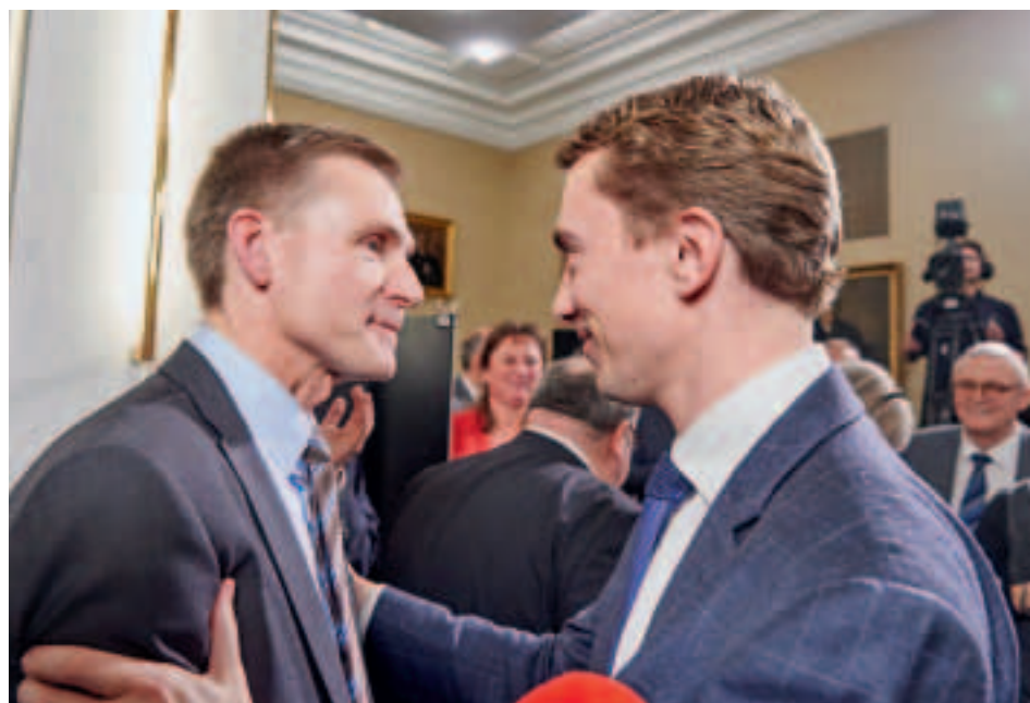
En glad og lettet Morten Messerschmidt fejrede det gode resultat af afstemningen om retsforbeholdet sammen med andre glade DF’ere i Snapstinget på Christiansborg – her i selskab med Kristian Thulesen Dahl.

”Denne valgaften bør i virkeligheden være begyndelsen på noget helt nyt. Demokratiet virker. Vælgerne har talt. Nu er det op til politikerne at lytte. Jeg håber, at splittelsen mellem befolkning og flertallet på Christiansborg er noget, der havner på historiens losseplads. Nu må ja-siden til at vågne op og erkende, at de har været ude af trit med deres vælgere. Det er ikke danskerne, der har taget fejl, men de politikere, som bilder sig ind, at Danmark skal ind til kernen af EU”. •